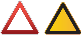
Triangular: te avisa de algo.