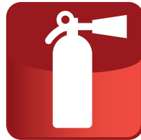
Rectangular: salida de emergencia, extintores y mangueras contra incendios.